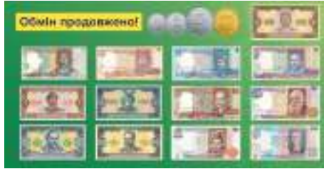
Старі купюри.

«Вони вже тривалий час вилучаються з обігу. Їх не приймають під час готівкових розрахунків за товари та послуги», — заявили в НБУ.