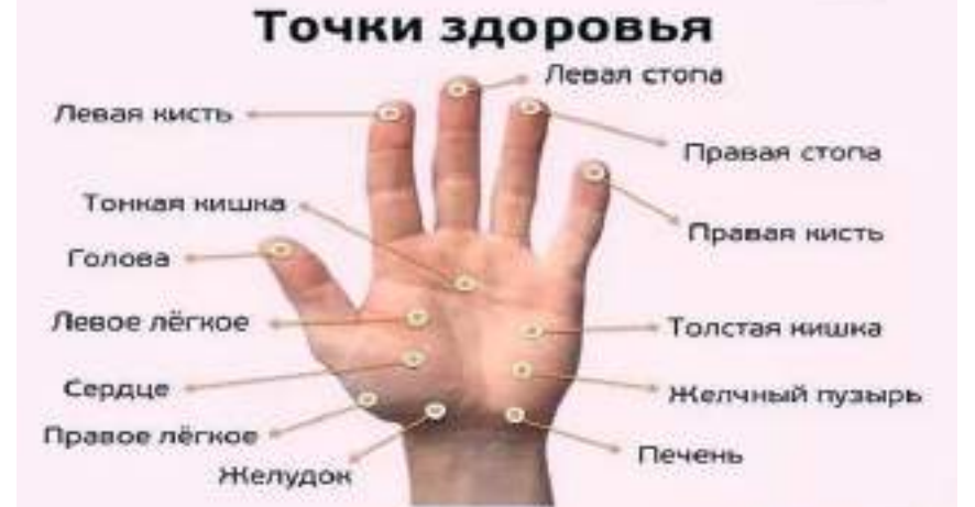
Точки здоров'я на руці, которые отвечают за наши органы и тело. Если что-то заболело, достаточно помассировать одну из подходящих точек в течение трех минут.