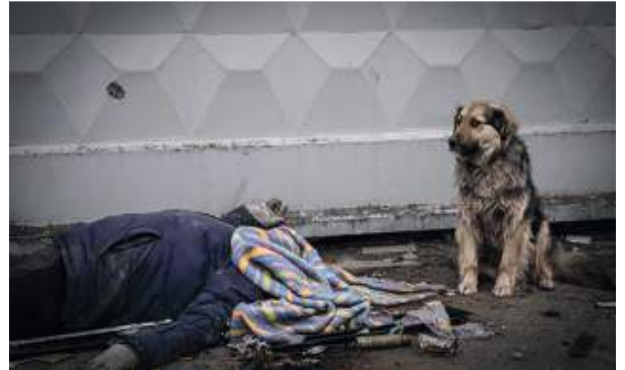
«Різанина в Бучі та Ірпені».

Світлину чеський фотограф зробив невдовзі після деокупації Київської області.