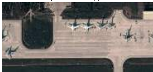
Фото пошкоджених літаків, які публікувалися наступними днями, вказували на те, що пошкодження не були незначними та найімовірніше ці літаки виведені з ладу надовго, якщо не назавжди.

Показово, що удар по авіабазах було завдано за день до чергового масованого ракетного нальоту на Україну і літаки, які були виведені з ладу, мали би брати участь у цій атаці.